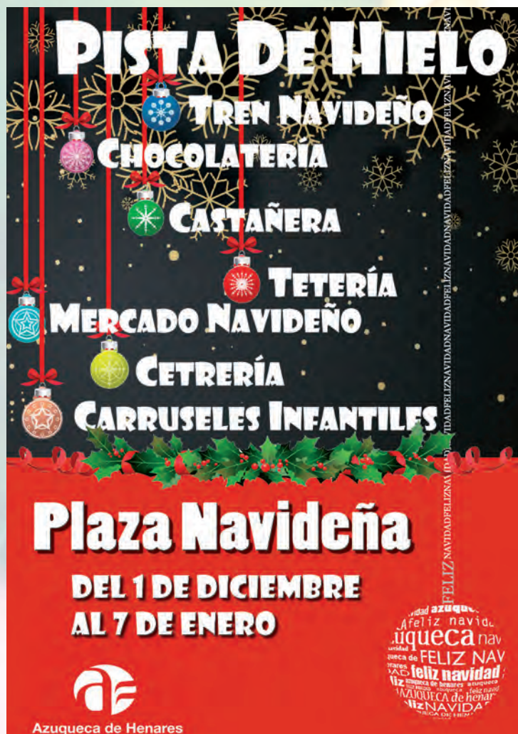
Cartel promocional de la Plaza Navideña