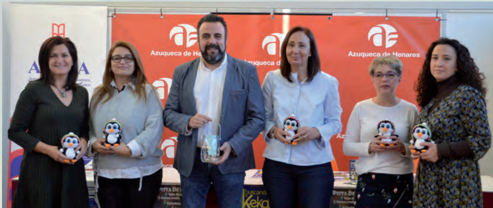
El alcalde, las concejalas de Fiestas y Comercio y representantes de ACEPA, tras la presentación del programa navideño realizada en el Centro de Ocio Río Henares

Se desarrolla entre los días 18 y 31 de diciembre