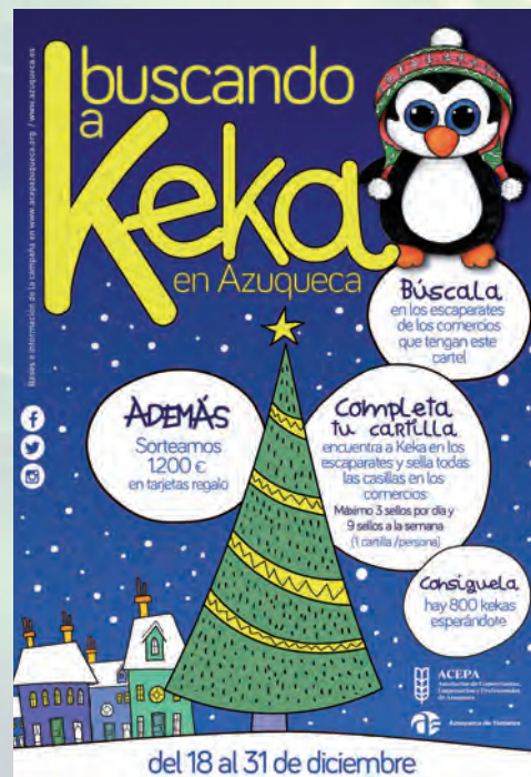
Cartel promocional de 'Buscando a Keka'

Quienes completen la cartilla (18 sellos en dos semanas, entre el 18 y el 31 de diciembre) podrán retirar un peluche -hay 725 disponibles- en los comercios adheridos y participar